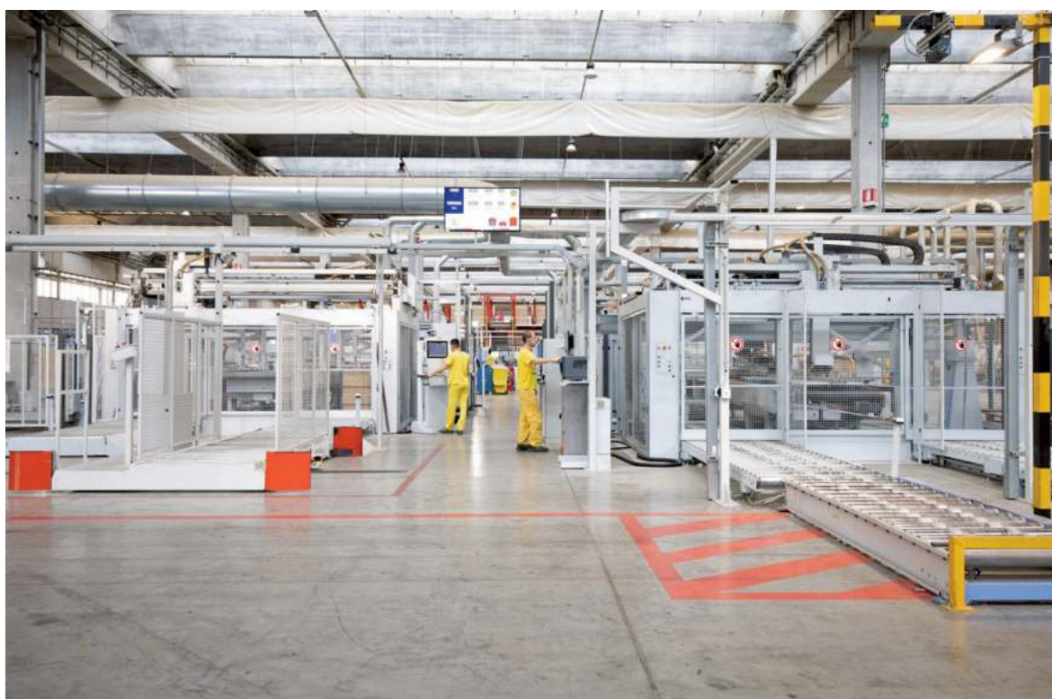
Stabilimento Composad, Viadana (MN). Composad plant, Viadana (MN).

The goal is "to arrive first, with more and more beautiful and sustainable ideas and solutions. The dominant factor remains the 'sensitivity' of Italian culture, which enables our creative and commercial people to win international challenges. This is 'Made in Italy' and the objective of doing business is always to create value in society, respecting people, rules, territory, environment, nature, and fostering the best synthesis of ingenuity and creativity, being able to see what others do not see, or do not yet see."