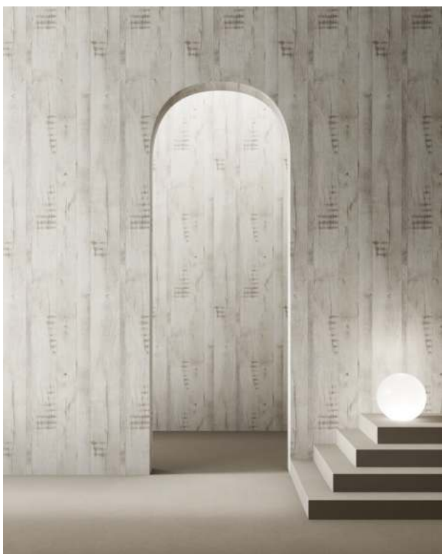
Pannelli Ecologici Gruppo Saviola. Ecological Panels Gruppo Saviola.