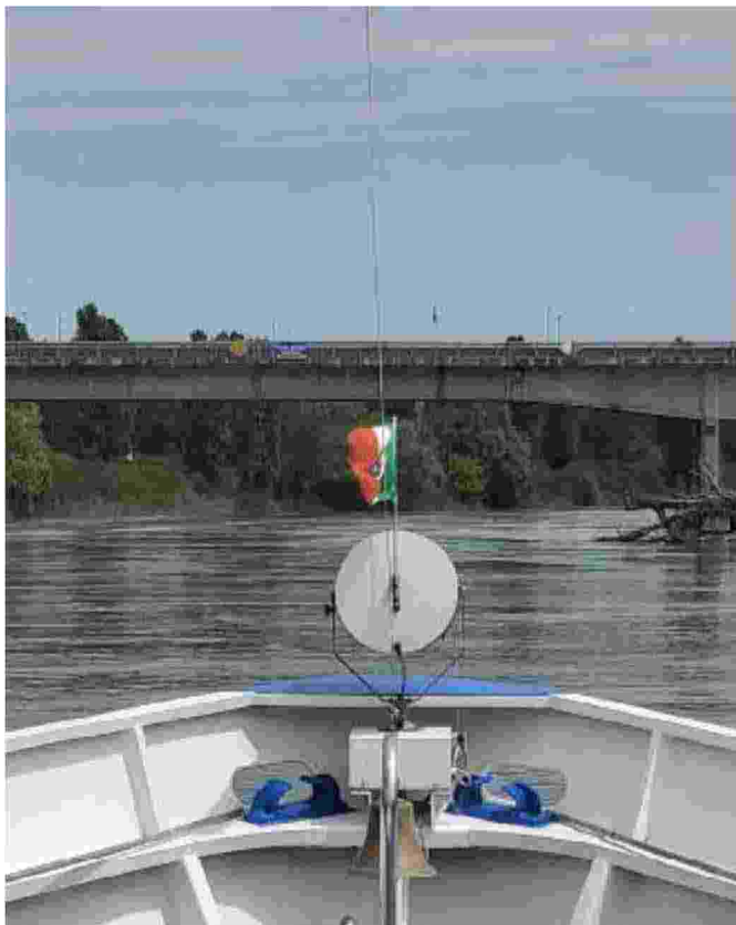
Il Distretto del Po Qui si concentrerà l'attività del network

Ritaglio stampa ad uso esclusivo del destinatario, non riproducibile.