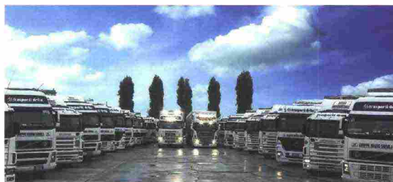
In apertura, una veduta dello stabilimento di Viadana. In alto, Alessandro Saviola. A sinistra, la "flotta" Saviola.

Lo stand di Saviola, un'isola di 150 m 2 realizzata interamente con materiali e pannelli del Gruppo (100% ecologici) , lo scorso anno ha proposto elementi creativi che hanno permesso ai visitatori di cogliere la qualità dei pro-