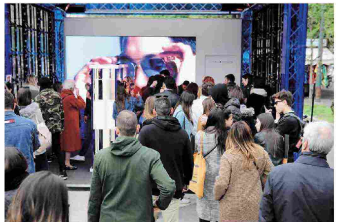
Interni ed esterni della Luxury Lodge, ideata dall'architetto Roberto Perego per Crippa Concept, azienda che si distingue per la progettazione di 'mobile home' dal design ecologico e raffinato. Qui sopra, a destra, l'installazione interattiva di Tommy Hilfiger Eyewear by Safilo, dove moda e design si incontrano in un progetto ipertecnologico.